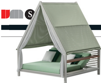
▲ Buitenbed 'Cottage' van de Spaanse ontwerper Patricia Urquiola, prijs op aanvraag. kettal.com