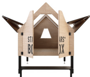
▲ Geïnspireerd op de schuilhutjes van schapeherders in de Ligurische Alpen, ontwierp Italiaans architectenbureau Officina82 de houten StarsBOX. Vanaf € 6.000. starsbox.it