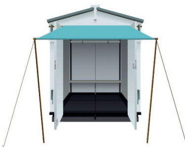
▲ Geen spijkers, bouten of schroeven nodig: de kunststof panelen van het 'Kebbin'-huisje schuift en klikt u zelf in elkaar. Vanaf € 1.995. dehuisfabriek.nl